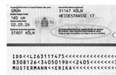
Darstellung am Beispiel des Personalausweises