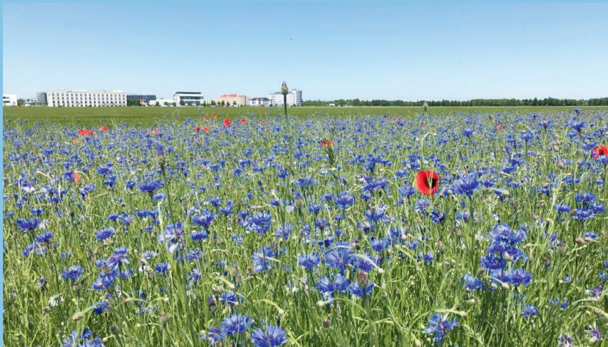
Blühwiese im Süden